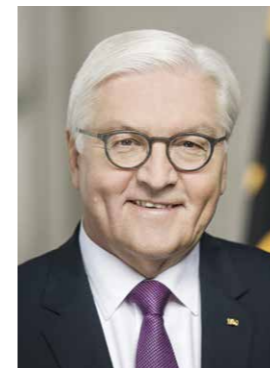
Frank-Walter Steinmeier Bundespräsident

sind für unsere Gesellschaft und Kultur einfach unverzichtbar.